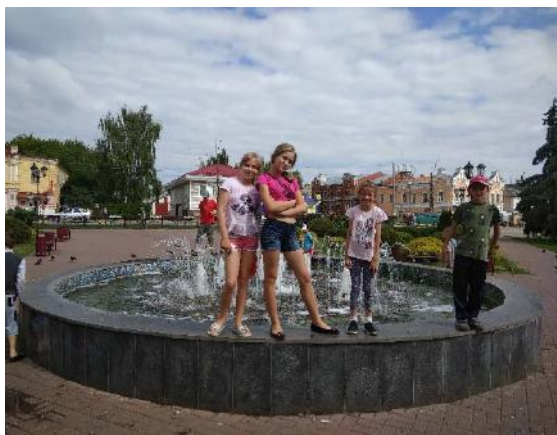
Фонтан около городской площади