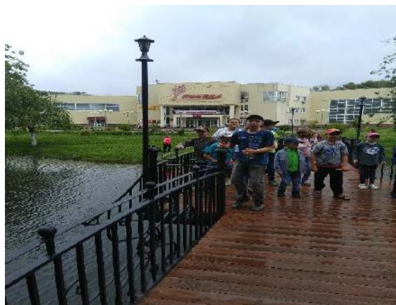
Фонтан около ФОКа «Победа»

Каждый день подводятся итоги и проводится «Отрядный огонек».