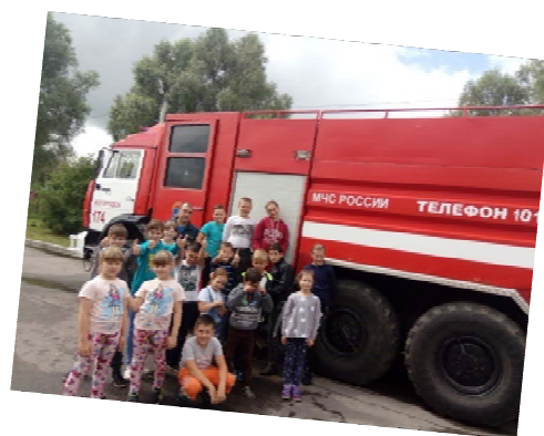
Встреча с представителем ВДПО.